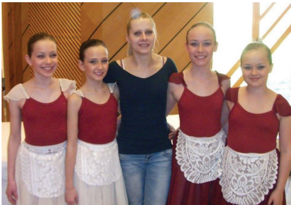
Na soutěži Pardubická arabeska

Mnoho z nich však také po ukončení studia na naší škole přechází na taneční konzervatoř, protože dobře vedená spolupráce také snižuje stres u žáků při přijímacích zkouškách a zároveň snižuje riziko vnímané studenty ve spojení s pokračujícím studiem na neznámé střední nebo vysoké škole. Kvapilka se prezentuje na mnohých koncertech, národních i mezinárodních soutěžích a přehlídkách, na kterých její žáci získávají přední umístění.