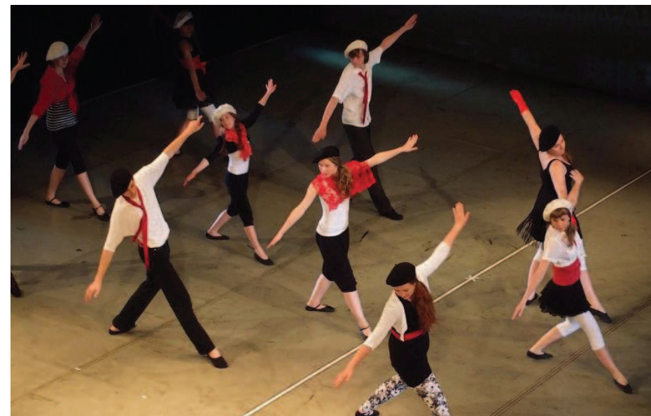
Tanec nás spojuje, 25. 5. 2014, Mahenovo divadlo