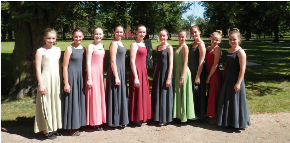
Vystoupení na oslavách k 90 letům založení ZUŠ Hranice

Takto pohodově jsme s písničkami protančily 7 let. Taneční hodiny už nebyly jen 45 minut, ani nebyly jen jednou týdně. Naše cácorčky už nebyly prťaty, co bez nás nešly ani před šatnu. Začaly jsme mít slečny, které se osamostatňovaly a rostly do krásy jak na oko, tak i v pohybu. Je to radost dívat se na ně, jak si pomáhají, jak drží spolu a samy se malují, upravují... Zjistily jsme, že jezdíme vlastně nejen kvůli děvčatům,