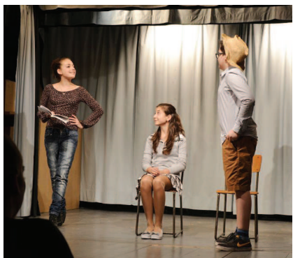
Večer monologů, 14. 1. 2014

Taneční obor sídlí v prostorách Taneční konzervatoře v Brně a vzhledem k tomu se pyšníme vynikajícími tanečními sálami pro výuku našich žáků.