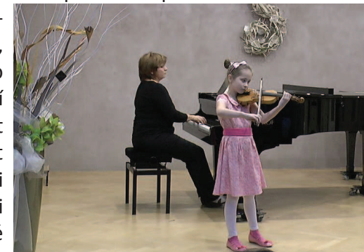
Žákovský koncert 18. 11. 2014, sál ZUŠ