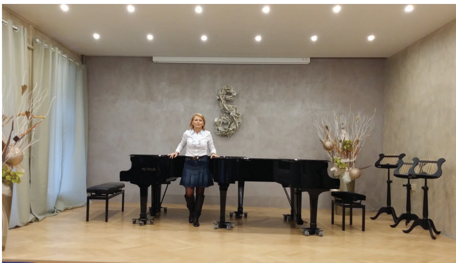
Koncertní sál ZUŠ Jaroslava Kvapila, Brno