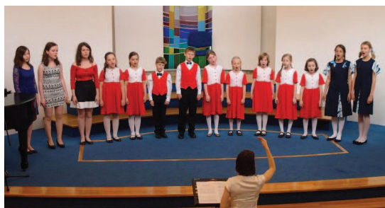
Letní koncert PRIMAVERA, 24. 5. 2014

Prezentace našich koncertů tradičně vychází ze zapojení žáků a učitelů všech čtyř oborů školy, bývá však širší, než je zvykem. Žáci prezentují své umělecké schopnosti nejen na pódiu koncertního sálu, ale také před koncertem a o přestávce