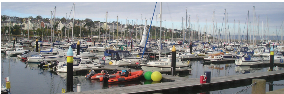
Bangor v Severním Irsku

Ve středu se na hotel sjížděli ostatní kolegové z projektu Comenius, kde jsme se s nimi vítali, společně diskutovali a měli jsme také možnost poznat Bangor a moře omývající břehy samotného města.