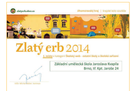
Soutěž Zlatý erb 2014, 31. 3. 2014