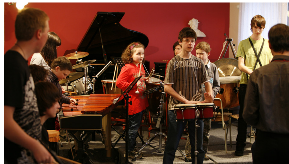
Soubor bicích nástrojů „Dr.Um“ – generální zkouška před koncertem

a navíc to sám pořádně nevím. MIDI chápu jako soubor dávající počítači informaci (nejen) o hudbě. Informaci kdy, v jaké délce, jakou intenzitou a podobně. Pokud nejsem tak chytrý já, nevadí. Jsou zde programy, které si s MIDI programy rady vědí. Mezi nejúžasnější z nich patří DAW (digital audio workstation). Naše škola zakoupila licenci na program Steinberg Cubase, vy samozřejmě můžete jít jinou cestou. Dáte-li DAW programu „sníst“ MIDI soubor vytvořený například notačním programem, vytvoří si tak zvané MIDI stopy. Na monitoru je uvidíte jako barevné pruhy – pro každý nástroj jeden. MIDI si většinou „pamatuje“, který nástroj jste měli na mysli při psaní not. Úžasné však je to, že se můžete dodatečně rozhodnout, aby namísto zobcové flétny zněla marimba a podobně. Možnosti pro soubor bicích nástrojů jsou neskutečné.