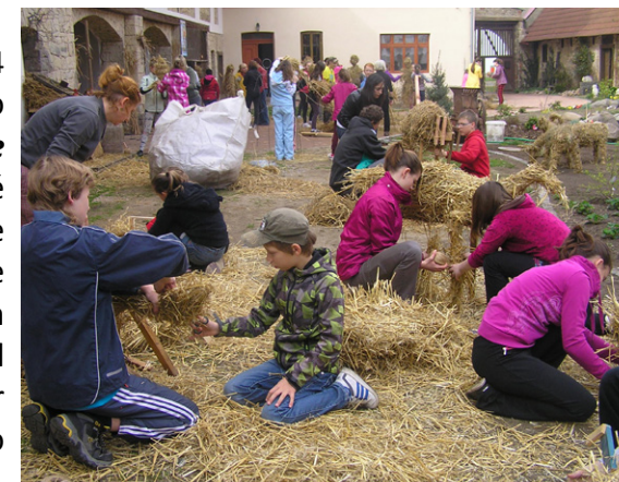
Příprava betlému slámováním