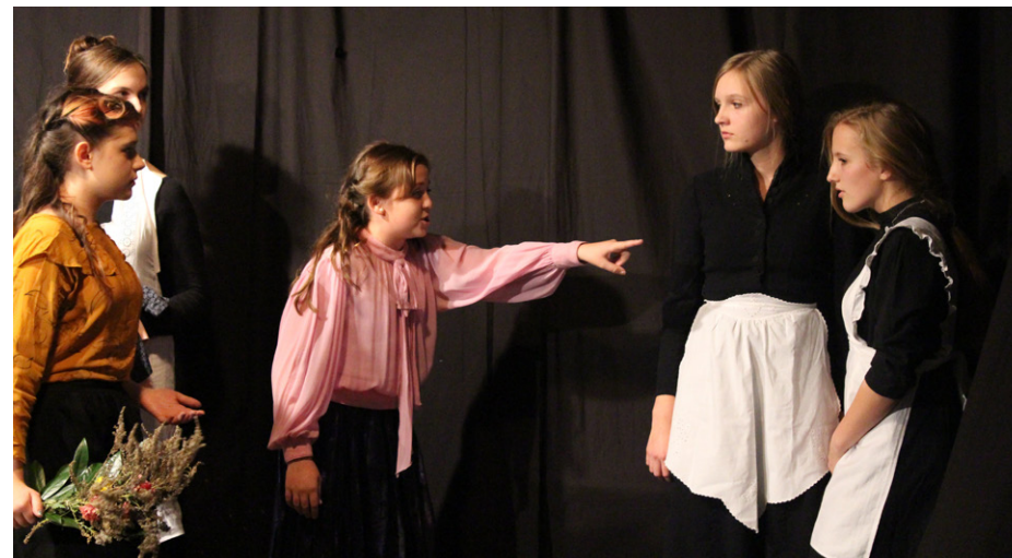
Kouzlo amuletu, autorská inscenace

Mladivadlo nejčastěji realizuje adaptace původních dramatických předloh. Aktuálně je to např. „Probuzení jara“ Frank Wedekinda, „Strašidlo Canterwillské“ podle Oscara Wilda a v procesu přípravy je „Sen noci svatojánské“ Williama Shakespeara. Soubor se nevyhýbá ani vlastní autorské tvorbě. Například inscenace „Kouzlo amuletu“ vychází z inspirativního místa za Litoměřicemi, z tajemné, nyní již téměř rozbořené vily, ke které se váží různé pověsti a která se stala inspirací pro velmi působivou divadelní hru. V další autorské hře žáci oživilí místní pověsti a legendy a ve stylu jarmarečního „tyjátru“ vytvořili divácky velmi úspěšnou hru „O lásce a mordech“.