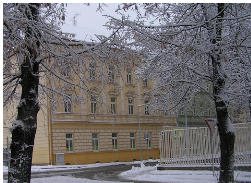
Budova ZUŠ Louny

V letošním školním roce oslavila Základní umělecká škola Louny krásných 65 let. Zdá se to skoro neuvěřitelné, že uplynulo pět let od doby, kdy škola pořádala ke svým šedesátinám Štafetové klavírátky , při kterých vytvořila rekord v nepřetržitém hraní na klavír. Pořádala celou řadu koncertů, vernisáží, a vystoupení. Vše vyvrcholilo Veletřhem nápadů , kde štafetu oslav převzalo od ZUŠ Louny Vrchlického divadlo. Oslavy šedesátého výročí byly opravdu velké a celoroční. Po jejich skončení jsme si ve škole slíbili, že další tak velké oslavy uspořádáme, až nám bude sedmdesát.