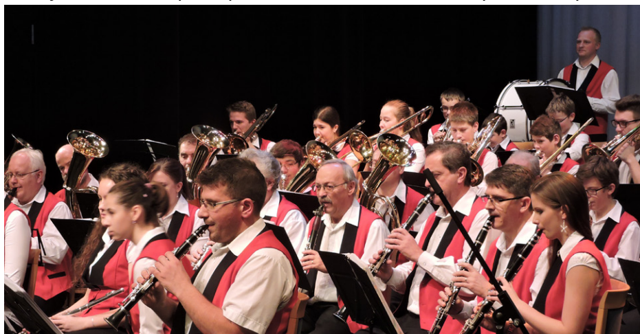
Dechový orchestr ZUŠ Louny

Uvedu pouze rok 2014. V hudebním oboru obdržel nejvyšší ocenění Dechový orchestr ZUŠ v Národní soutěži ZUŠ ve hře dechových orchestrů, kde v ústředním kole získal zlaté pásmo. Ve výtvarném oboru si nejvíce ceníme postupu do ústředního kola a vystavení výtvarné