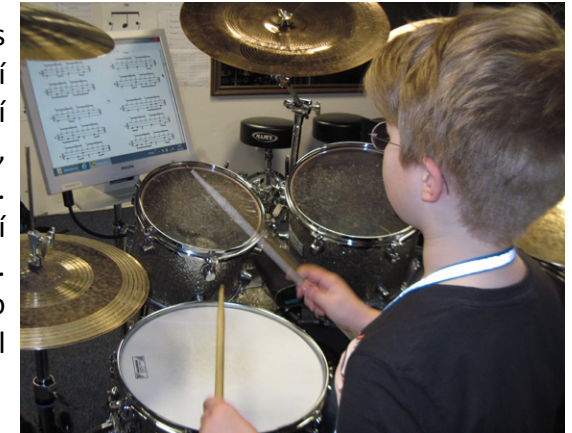
LCD display s notami přímo ve hře