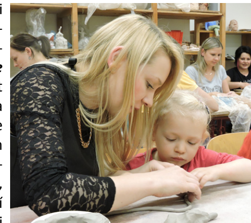
Tvoření s rodiči

Jsme zaměřeni na spolupráci a na práci v projektech. Každoročně pořádáme celostátní festival pěveckých sborů Hrajeme s Orffem . V roce 2014 projekt podpořil Kulturní fond Města Louny, Ústecký kraj a Nadace Život umělce. Spolu s občanským sdružením Stopy, o.s. jsme vydali knihu Louny město Louny , která vznikla na základě naší spolupráce se všemi lounskými základními školami. Projekt podpořilo Město Louny. Samostatně jsme vydali brožurku Melodie Loun . Spolupracujeme se všemi ZŠ a MŠ v Lounech, připravujeme pro ně různá vystoupení a projektové dny. Tvoříme s rodiči a Koncert spolu s rodiči je projekt školy, kde spolupracujeme s rodiči, kteří se spolu se svými dětmi aktivně zapojují do výuky. Česká mše vánoční J. J. Ryby je projekt společného koncertu v divadle, kde máme vždy pozvané hosty. Masopustní veselí je nadregionální akce spoluorganizovaná se Stopami, o.s. a Hydroclarem ve Skupicích u Postolopr. Projekt byl v roce 2014 podpořen Kulturním fondem města Louny a Ústeckým krajem. Velikonoce na statku byla v roce 2014 největší regionální akce spoluorganizovaná se Stopami, o.s. a Hydroclarem ve Skupicích u Postolopr. Cyklus koncertů k roku české hudby jsme spoluorganizovali se Stopami, o.s. a podpořil ho Kulturní fond města Louny, Ústecký kraj a Nadace Život umělce. Záštitu nad galakonzertem převzal hejtman Ústeckého kraje. Součástí projektu Rok české hudby bylo vydání vánočního CD a podpořil ho Státní fond kultury ČR.