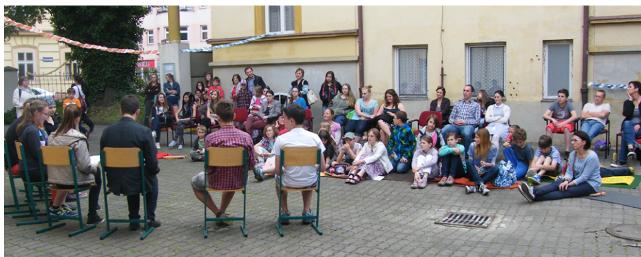
Divadelní piknik – scénické čtení