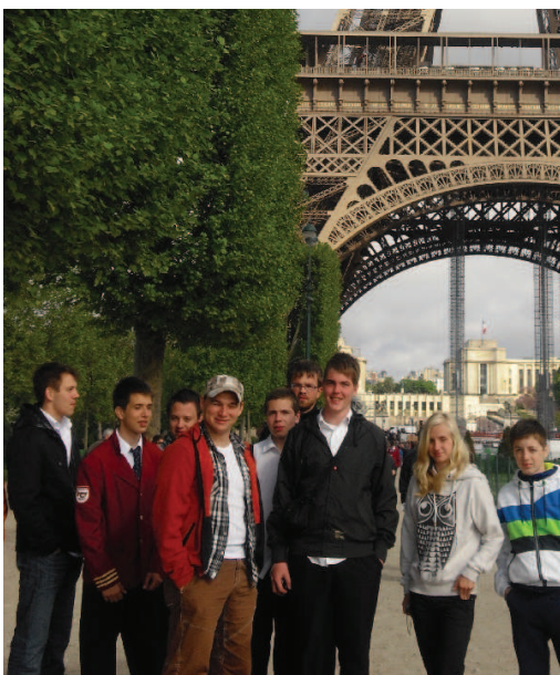
Koncertní zájezd do Francie

I rok 2014 byl plný koncertů, vystoupení a zájezdů. Opět jsme si zahráli např. v České Kamenici, Pirně, Giulianově a jinde, ale hlavní událostí byla opět Národní soutěž ZUŠ ve hře dechových orchestrů. Tentokrát došel orchestr až na vrchol a v celostátním