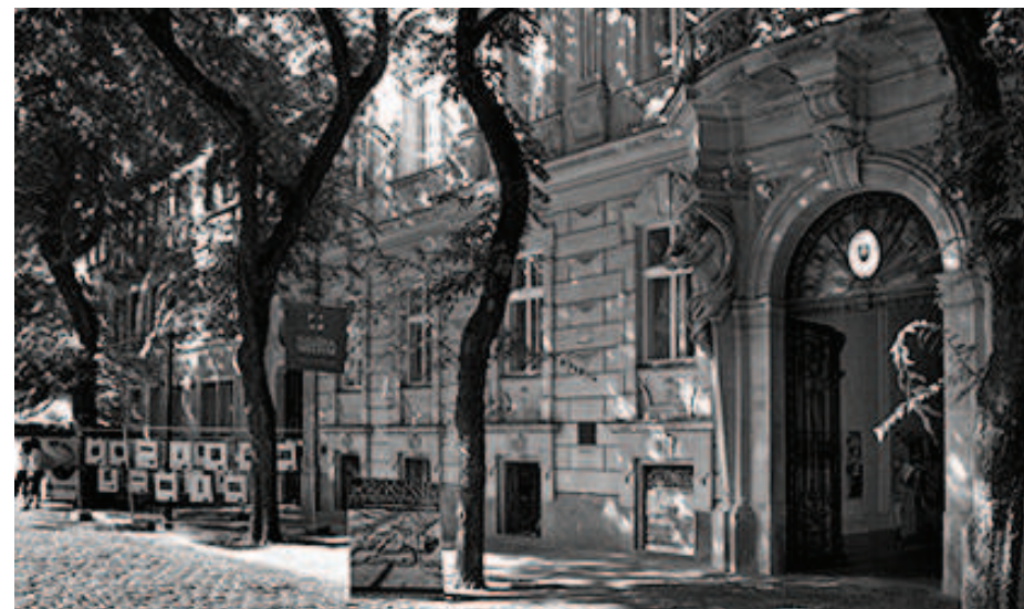
Vysoká škola výtvarných umení (staré foto)

znižovať koeficient skupinového vyučovania na úkor individuálneho. Avšak jedným z mála pozitív, ktoré školy v súčasnosti vnímajú, je to, že môžu zriaďovať elokované pracoviská školy v rámci svojho kraja a ísť priamo za svojimi žiakmi do materských a základných škôl. Rovnako tak školy nemajú určenú fixnú kvótu počtov žiakov, koľko škola môže v školskom roku maximálne vyučovať. Inými slovami, vedenie ZUŠ, ktoré má chuť, ambície a poznanie, tak môže rozvíjať plneodborovú školu na viacerých miestach súčasne a v rámci svojho regiónu vybudovať silnú školu s dlhou tradíciou.