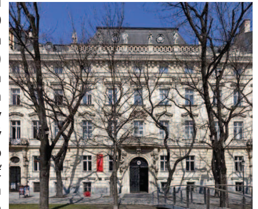
Budova VŠVU v Bratislave

na Slovensku si vyžadovali kvalifikované kádre. V roku 1949 vznikli v Bratislave Vysoká škola muzických umení (VŠMU) a Vysoká škola výtvarných umení (VŠVU). Vznik hudobných škôl, zriadených v období rokov 1919—1945, znamenal výrazný posun v rozvoji hudobného vzdelávania. Začali sa zakladať hudobné školy (Hudobná škola pre Slovensko — 1919, Hudobná škola v Martine — 1919, Hudobná škola vo Zvolene — 1919).