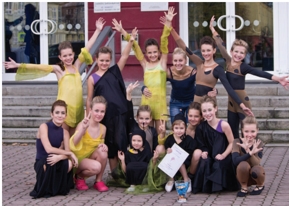
Taneční soutěž Paforta v Ostravě

Plánujeme otevření studia, které bude pro děti mladší 5 let a budou chodit na výuku maminky s dětmi. To už máme ve fázi příprav. A také chystáme na příští rok rekonstrukci školní budovy s tím, že bude fasáda školy vypadat jako dřívě. O to se snažíme již delší dobu, tak snad to všechno dobře dopadne.