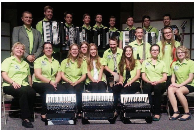
Po koncertě v Harvest Bible Chapel

prostředí a vděčného posluchačstva, které ocenilo hlavně klasickou hudbu a dechovky. Církevní domy zase měly pro nás muzikanty obrovské kouzlo v rozlehlosti sálů a technickém vybavení. Například náš poslední koncert v Chicagu se odehrál v sále pro 2200 lidí. Program připomínal velký barevný talíř chuťovek ze všech koutů hudebního království. Po úvodu, kde většinou zazněly klasičtější skladby (Vltava, Dvořákovo Largo) a ukázky z filmů a muzikálů (West Side Story, 7 statečných), nasadil orchestr jemu nejvlastnější swing a jazz, pak okénko zvukomalebné Francie nebo Španělska, před závěrem muzikanti rozdávali publikum nějakou tou sambou či rockovým hitem a dorazili ho osvědčenou českou dechovkou.