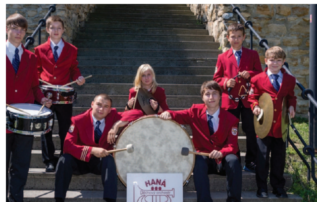
Focení v Přerově na hradbách

kole se v kategorii do 16 let nad 45 členů umístil ve zlatém pásmu. V té době měla kapela 82 členů a věkový průměr 15,6 let. „Tož tak my si tu žijem, na téj Haněj.“ A doufám, že ještě dlouho budeme žít. Jsme tady proto, abychom co nejvíce dětí přivedli k užitečné zálibě. Aby ony poznaly, co je to dobrá práce v dobré partě, protože my jsme vždycky byli dobrá parta a vždycky budeme. A vždycky budeme rádi rozdávat pohodu, radost a dobrou náladu všem, kdo nás budou chtít poslouchat. Pokud nás taky chcete slyšet, zveme vás 30. 5. 2015 do tenisové haly v Přerově. Od 18 hodin tam zahrajeme slavnostní koncert ke 40. výročí našeho orchestru , při kterém na pódiu zasednou nejen současní, ale i mnozí bývalí členové DO Haná (víte, že nedávným členem orchestru byl i nynější ministr zemědělství Ing. Marian Jurečka?), aby společně oslavili ty velké narozeniny. Přijďte také za námi a přijďte včas. Vstup je volný a míst jen 500.