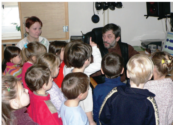
Návštěva dětí z mateřských škol

Vyrostl jsem na vesnici, ve Chvalkovicích na Hané. Asi jsem měl v životě úžasné štěstí a čerpám z toho dodnes. Od pěti let jsem hrál ochotnické divadlo, 6 roků jsem hrál na housle a 3 roky na klarinet. Celou tu dobu jsme recitovali, vystupovali a bavili se. Vlastně naše vesnice byla schopna sama sebe kulturně pobavit, podchytit, vychovávat. Existovaly tam samozřejmě i spolky jako Sokol či Svazarm. Hrál se fotbal, jezdili jsme bikros. Všechno jsme měli v jedné dědině. Bylo to něco úžasného.