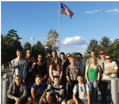
U St. Louis Science Center

ze tří okruhů: školní mládež, důchodci a spřátelená církevní společenství. Ve školách jsme si užívali živelného fandění, nadšeného potlesku a vřestění stovek amerických mláďat, v domovech pro seniory zase překrásného