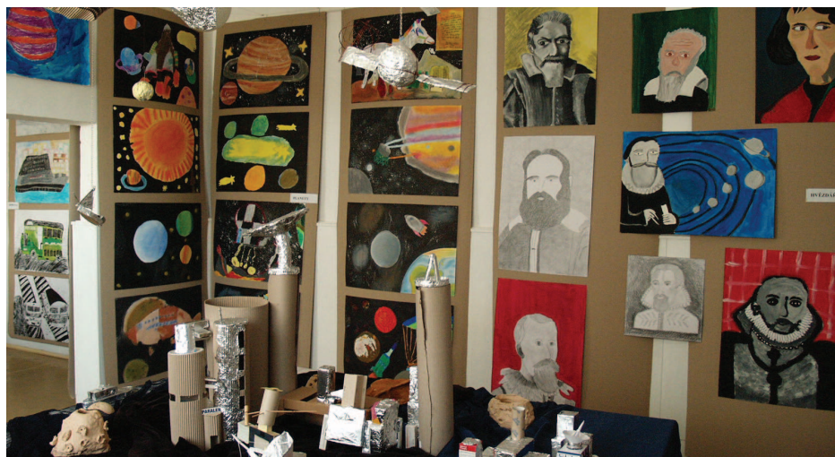
Vernisáž o historii ZUŠ v městském muzeu