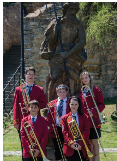
U sochy Neptuna v Přerově

Dôležitým vývojovým zlomom pre základné umelecké školy bolo prijatie nového školského zákona (2008), ktorým boli ZUŠ vyňaté zo školských zariadení a začlenené do sústavy škôl.