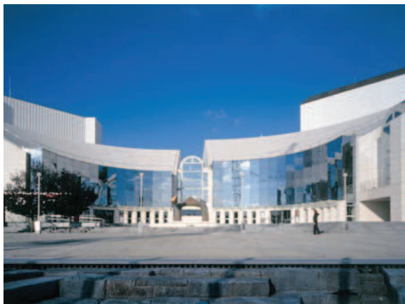
Slovenské národné divadlo

Najmä po roku 1945, kedy základné umelecké školy prechádzali viacerými legislatívnymi i organizačnými zmenami možno vývoj umeleckého školstva na Slovensku rozdeliť do štyroch vývojových etáp. Do prvej etapy spadajú hudobné školy, súkromné hudobné školy vznikajúce po roku 1919 a mestské hudobné ústavy zriadené na základe školského zákona v roku 1948. Druhý medzník predstavuje poštátne mestských hudobných ústavov v roku 1951 – organizácií a riadení základných hudobných škôl bol vydaný na pražskej celoštátnej konferencii o hudobnej výchove dokument (1956), podľa ktorého schválilo Ministerstvo školstva a kultúry opatrenie o začlenení ZHŠ do jednotnej školskej sústavy. Tretím významným medzníkom vo vývoji umeleckého školstva na Slovensku bol rok 1961, kedy vznikli z hudobných a výtvarných škôl ľudové školy umenia (LŠU). LŠU mohli v období rokov 1961-1971 zriaďovať päť umeleckých odborov: hudobný, výtvarný, tanečný, literárno-recitačný a dramatický. Zlúčením posledných dvoch vznikol literárno-dramatický odbor. V tomto období si školy budovali svoje ciele, poslanie a organizačnú štruktúru, na ktorú neskôr nadviazali základné umelecké školy. Poslednú štvrtú vývojovú etapu reprezentujú základné umelecké školy, ktoré vznikli transformáciou LŠU. Legislatívne zmeny v deväťdesiatych rokoch umožnili zakladanie cirkevných