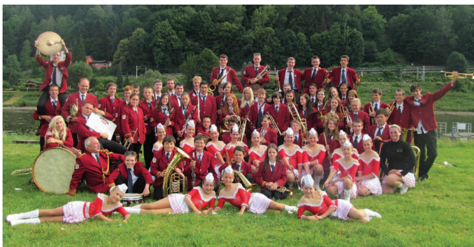
Mezinárodní hudební festival Česká Kamenice