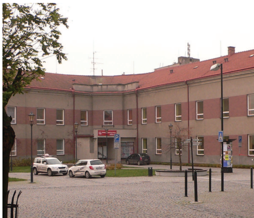
Budova ZUŠ Hranice

Příprava slavnostních vystoupení stála učitele i žáky spoustu práce a úsilí. Přáli jsme si, aby oslavy proběhly důstojně a my jsme mohli ukázat alespoň zlomek toho, co umíme. Příprava začala už v září a od ledna běžela celá série různých akcí — od novoroční akademie, která byla zasvěcena našemu výročí, přes vernisáž výstavy o historii naší školy v městském muzeu až po další akce, na nichž se mohli představit naši žáci.