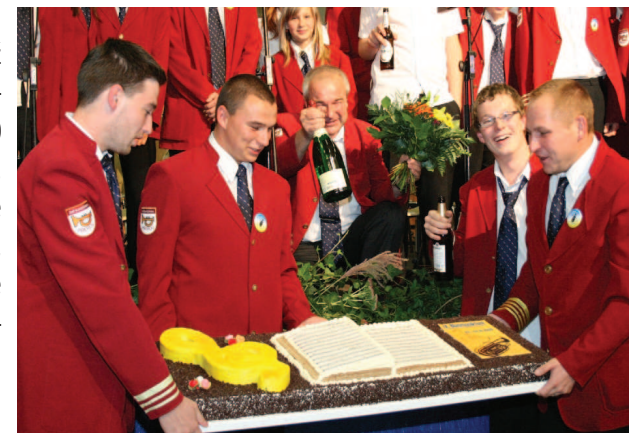
IX. Mezinárodní dechový festival v Bautzenu

místem. Tam byl totiž cenou dort o rozměrech cca 120x60 cm. To bylo něco. Obzvláště pro naše tubisty, protože, kromě marcipánové partitury a houslového klíče na něm zářila marcipánová tuba. Někdy je dobře i nevyhrát.