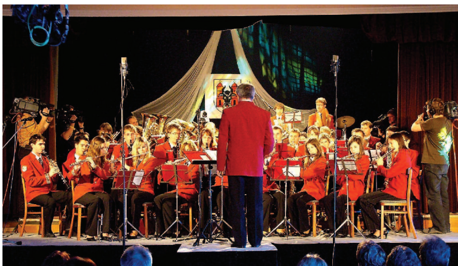
Natáčení pořadu ČT - A tuhle znáte?

Ani v dalších letech orchestr ve své činnosti nepolevil. Kromě dalších koncertů a kulturních akcí nejen ve svém domovském městě i dalších městech v ČR a jinde v Evropě nezapomněl ani na svoje postavení školního orchestru. Výsledkem této práce byl v roce 2007 postup do celostátního kola soutěže dechových orchestrů základních uměleckých škol. Možná i tato skutečnost byla jedním z důvodů, aby Česká televize vyzvala v prosinci 2007 Dechový orchestr Haná k natočení televizního pořadu A tuhle znáte? Jednalo se o hudební pořad, který mapoval život a práci vybraných českých orchestrů nejen z kategorie školních, ale i „dospělých“ a poloprofesionálních. Zařazení DO Haná do této společnosti také vypovídá o jeho kvalitách. V lednu 2008 se kapela přihlásila do Mezinárodní soutěže dechových orchestrů Praha 2008 a při svém prvním účinkování se umístila