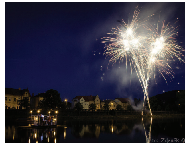
Závěrečné fanfáry a ohňostroj

fanfáry a v deset hodin ukončil oslavy nádherný ohňostroj.