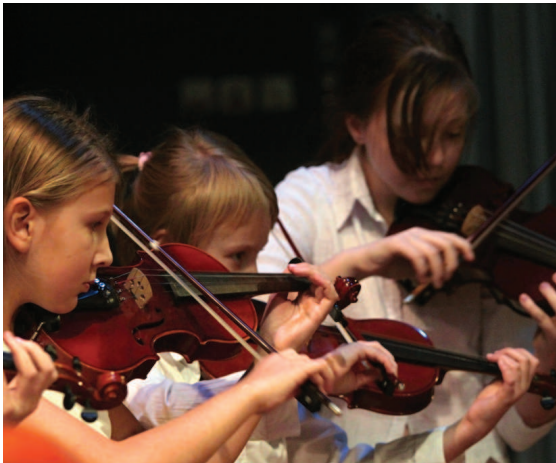
Smyčkový soubor ZUŠ Hranice

Ano, máme jeden nový předmět, který není standardní. Je to náš specifický obor, který jsme sami vymysleli. Jmenuje se POS — přípravné obecné studium. Přípravné studium je dvouleté, pro pěti až šestileté děti, kteří se připravují na další, základní studium. Toto se dělí na dva druhy přípravek. Skupinková výuka, kde děti začínají přímo na vybraném nástroji.