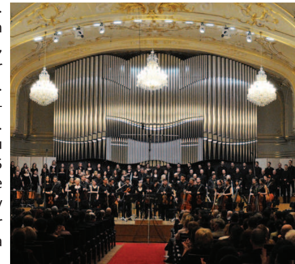
Koncert symfonického orchestra VŠMU

V dnešnej dobe v SR pôsobí 311 základných umeleckých škôl, v ktorých pôsobí vyše 6,5 tisíc učiteľov, ktorí vzdelávajú takmer 160 tisíc žiakov. Zaujímavé je aj celkové zloženie základných umeleckých škôl na SR, z ktorých 198 je verejných, 107 súkromných a 6 cirkevných. Školy môžu od roku 2009 zriaďovať aj veľmi zaujímavý, piaty odbor a to audiovizuálny. Od roku 2004 zaznamenávame veľmi rýchly nárast počtu súkromných ZUŠ. V tomto období sa ich počet zvýšil z 23 na 62, čo predstavuje takmer trojnásobný nárast počtu. Podobný trend bol zaznamenaný aj v počte žiakov. Ten začal narastať v roku 2004. V rokoch 2005 a 2006 medziročne vzrástol počet žiakov súkromných ZUŠ takmer dvojnásobne, z 11 662 na 21 274.