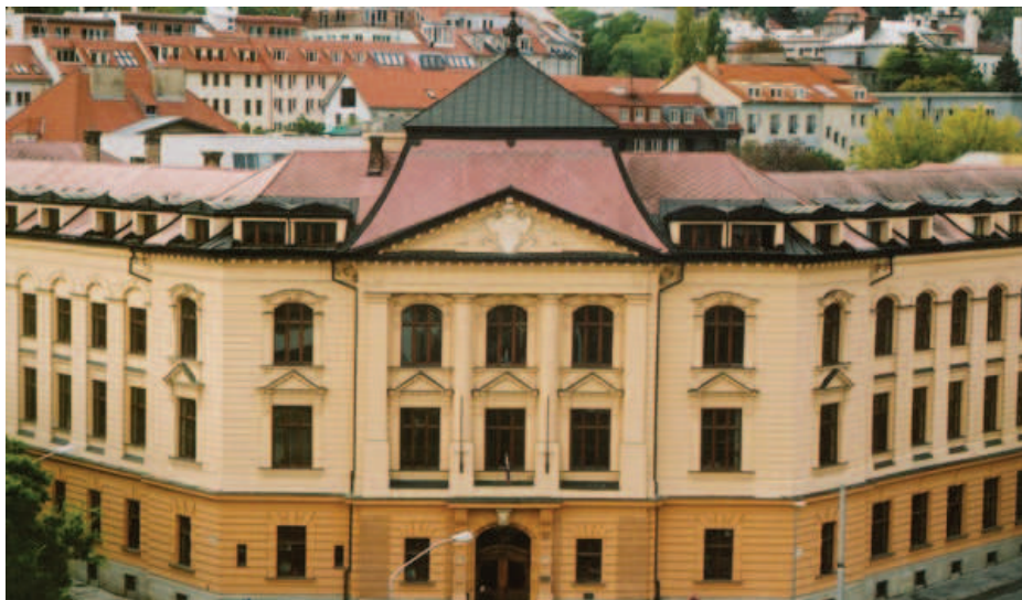
Vysoká škola múzických umení VŠMU

Finančné prostriedky z výnosu dane nie sú účelovo viazané, závisí od svojvôle zriaďovateľa (obce alebo samosprávneho kraja), koľko finančných prostriedkov ZUŠ prideli. Následky sú potom také, že niektorá