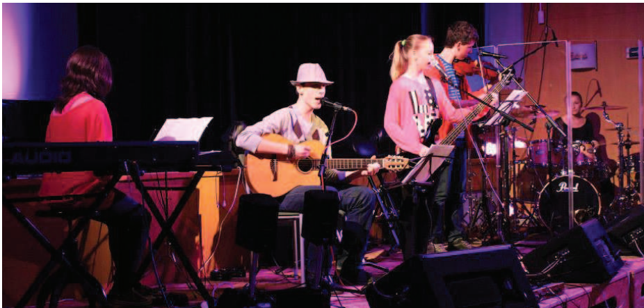
Začínající kapela No Comment

Hlavní vizí akce je snaha o propojení všech možných nástrojů a tance. Osobně mám rád, když třeba akordeon či flétna nehraje sama s klavírem,