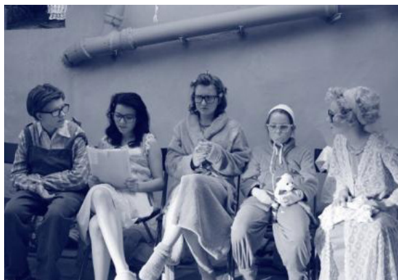
Divadlo: Takové normální ráno

Zaměřujeme se v podstatě na ty skoro nejmladší umělce. Jako hosty a inspiraci pro naše žáky zveme studenty hudebních a tanečních konzervatoří i profesionály, kteří mají naši školu rádi. Například ty, kteří žijí v našem městě a okolí, nebo učitele školy a jejich přátele. Akci realizujeme na konci školního roku před budovou školy pro širokou veřejnost. Je to pro nás událost roku, kde prezentujeme to nejlepší, co se žáci naučili. V celé budově školy probíhá výstava žákovských prací, pouštíme filmové projekce. Po celé škole se něco děje, je to takový den otevřených dveří. V loňském roce jsme zapojili i maminky, které napekly dobroty pro ZUŠku, žákovská tajná komise pak vybrala nejlepší dobrotu.