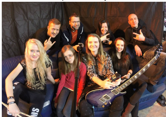
Dívčí kapela Young Ligthers

Tedy od začátku. Nejen že jsme nachystali článek s nadšením a milou spoluprací, ale hned jsem samozřejmě byla pozvána i na Facebooku, abych mohla prožívat přípravy s ostatními. Nebyly tam ale organizační informace. Pravidelně se zde objevovaly takzvané medailonky a v každém se představili jednotliví účinkující. Kapely, sólisti, soubory,