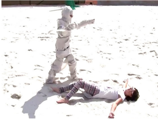
Smrt 12 Egyptanů – Tábor Pecka 2014

Nepletete, pořádáme Letní tematický tábor. Letos už počtvrté pojedeme s našimi žáčky na tábor, na kterém putujeme historií. Navštívili jsme pravěk, Egypt (ale byli jsme už i v budoucnosti) a letos se vydáme do Číny. Kreativě se na táboře meze nekladou. Rozdělíme se do skupinek, kde vytváříme obrazy, dobový oděv, šperky, film a nějakou plastiku. Také se věnujeme tanci. Divadelní ztvárnění doby a napsání scénáře je na jeden týden opravdu hodně práce. Tábor je vlastně takové malé soustředění, ale protože děti nechtějí o nic přijít a chtějí si všechno vyzkoušet, tak se stejně skupiny střídají ve všech činnostech.