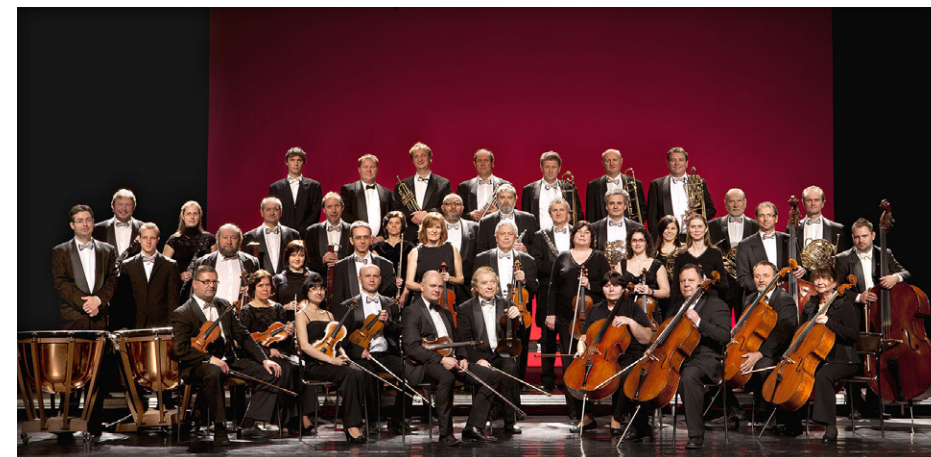
Orchestr opery Jihočeského divadla