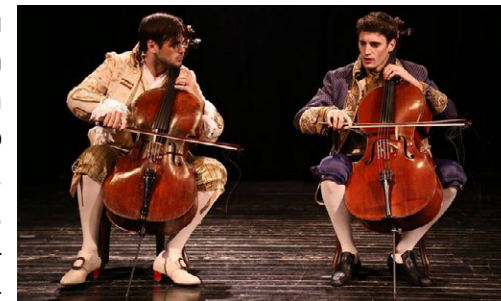
Duo violoncellistů 2Cellos

„Pane dirigente, já nemůžu chodit do orchestru, mám v tu dobu fotbal“, omlouvá se žáček na začátku školního roku. Fotbal, karate, ty jsou in. Pohyb dítěte je důležitý, pokud nechodí s ostatními dětmi normálně „ven“. Rčení praví: „Sportem ku zdraví“, ale