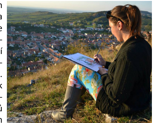
Studentka na plenéru – Mikulov

oborů základních uměleckých škol. Plánujeme také vyjet na plenér, kam vezmeme rodiče a žáky (děti). Plenér ve výtvarném umění znamená malování krajiny. Malování v plenéru zažívalo největší rozkvět v 19. a 20. století. Rozvinuli je jak realističtí, tak impresionističtí krajináři (z českých malířů například Julius Mařák a Antonín Slavíček). My se vydáme po jejich stopách krajinou, kde budeme malovat akvarel či olejomalbu, dle volby techniky autora.