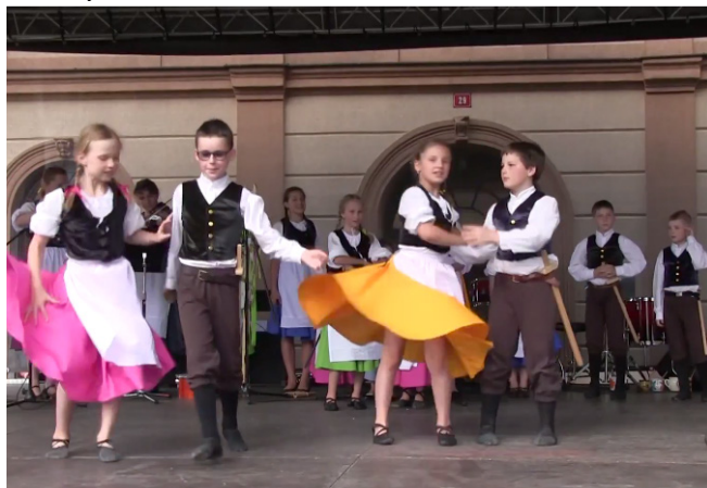
Folklórní soubor Kvítko

Školu jsem převzala v roce 2007 ve velice zajímavém stavu. Nebylo toho mnoho, na čem by se dalo stavět, a to se nakonec ukázalo jako zcela pozitivní. Dali jsme se do práce a začali budovat. Naše škola vyučuje ve všech čtyřech oborech, od roku 2011 vedeme doplňkovou činnost, vydáváme školní časopis Tamtamy , připravujeme kurzy pro dospělé, pořádáme cesty za hudbou a uměním pro naše žáky, organizujeme MIX festival , regionální výtvarnou soutěž, výstavy, plenéry, tábory a další. Máme hudební a taneční folklórní soubor Kvítko ,