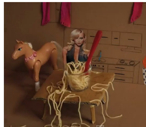
Foto z videoklipu písně Barbie

Jedná se o týdenní pobyt žáků naší školy (případně jejich kamarádů, kteří mají nějakou, třeba i malou, výtvarnou a taneční zkušenost). Je to takové intenzivní tvůrčí setkání v prázdninovém čase. Postup je klasický – výběr tématu, scénář, rozkreslení scénáře (storyboard) a pak se již pracuje. Podklady, materiál k filmům, se vytvářejí nejen studiově (dle scénáře), ale pracuje se i v exteriéru. Školu vedou naši učitelé (kteří jsou sami profesionálními umělci) a hosté (ti se specializují na efekty, hudební vstupy). V tanci je to stejné – téma, vybrat hudbu, vytvořit choreografii a pak již jen trénovat. Během týdenního programu jsou děti seznamovány s dalšími zajímavostmi, které se oboru týkají. Nejoblíbenější je promítání archivních filmů.