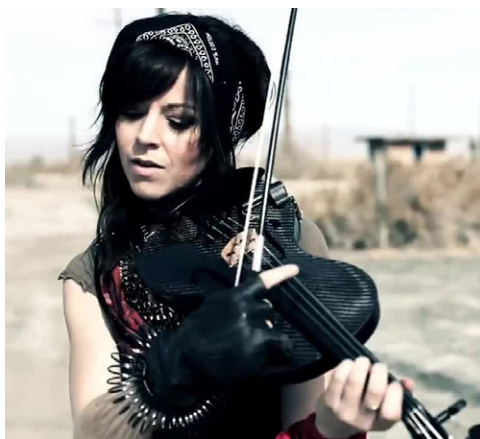
Tančující houslistka Lindsey Stirling

znáte i to druhé? V hudebce se dítě nezraní, dostane se mu zábavného strávení volného času přínosného, jak pro rozvoj jeho individuality, tak role týmového hráče. Fotbal si na Vánoce pod stromečkem nezahrajete, bez hřiště jste „nahraní“. Jak dlouho trvá kariéra fotbalisty? Ač se může zdát, že zatracuji jedno pro druhé, chci Vám ukázat příležitosti, o kterých možná netušíte, a dát malé doporučení: Vyberte pro své dítě takovou činnost, která mu jde. Někdo je dobrý hokejista, někdo snowboardista, někdo houslista. Víte, jaká jsou nejsledovanější videa na YouTube? Klipy hudebních skupin s miliony shlédnutí. Dokážete si představit vysílání Vašeho oblíbeného rádia bez hudby? Vybavíte si více jmen baseballistů nebo zpěváků? Víte, že Albert Einstein hrál na housle? Co Brazilec, to fotbalista, co Čech, to muzikant. Máme to v genech, naše muzikanty zná celý svět. Hudba tu vždycky byla a bude. A už dávno neplatí, že smyčcové nástroje hrají jen klasiku. V poslední době zažívají velký boom. Jazz, pop, rock, metal, filmová hudba. Zaposlouchejte se a uslyšíte je i tam, kde byste je nečekali. Zvuk „smyčců“ je krásný. Je to sice dřina, ale vyplatí se. :-)