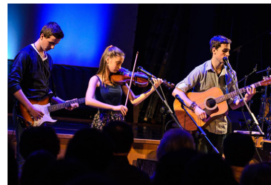
Skupina NO COMENT

tanečnice. Vše bylo mile a zábavně napsáno s fotografiemi usměvavých dětí i organizátorů. Děti na sebe i něco málo prozradily a jemně nastínily, na co se můžeme těšit. Všude bylo vidět to nadšení a těšení se. Vlastně mě to krásně vtáhlo do příprav – nenápadně, ale jistě.