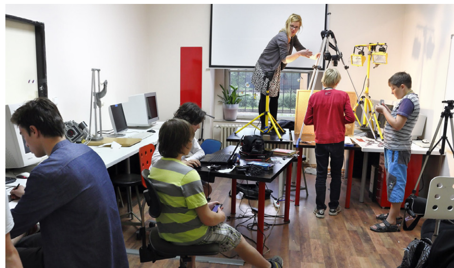
Studenti filmové tvorby při práci

Například máme své filmové studio. Součástí výuky výtvarného oboru jsou média a žáci od třetích ročníků se zde setkávají s animací, počítačovou grafikou. Pracují v různých programech, které pak mohou využít ve výtvarné tvorbě. V dnešní době je již počítač nedílnou součástí vzdělání. Hlavní náplní filmového studia je filmová tvorba, která zatím není součástí vzdělávacího programu a vedeme ji v doplňkové činnosti, protože škola nemá dostatečnou kapacitu žáků. Vznikají zde krátké filmy široce tematicky zaměřené, filmové koláže a videoklipy, ploškové animace a mnoho dalšího. V minulém roce vznikl spot o naší škole k 60. výročí. Studio mohou využívat i hudební obory, například ke skládání hudby. Za krátkou dobu fungování filmového studia jsme pod vedením vynikajících pedagogů získali i řadu ocenění. Pro inspiraci jsme si zajeli do Plzně na filmový festival Animánii, kde se žáci během tří dnů účastnili zajímavých dílen.