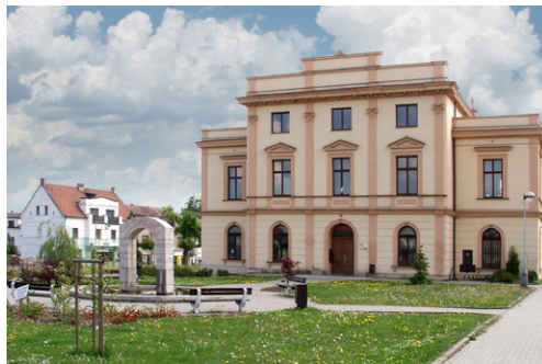
Budova ZUŠ Řevnice

Tradice dnešní Základní umělecké školy Řevnice se datuje od roku 1954. Tehdy vznikla v Řevnicích jedna pobočná třída Hudební školy v Berouně. Později se jako pobočka stala lidovou školou umění a rozšířila se o výtvarný, taneční a literárně-dramatický obor.