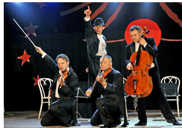
Smyčcové kvarteto MozART group

U smyčcových nástrojů je situace opačná než u jiných, dechových