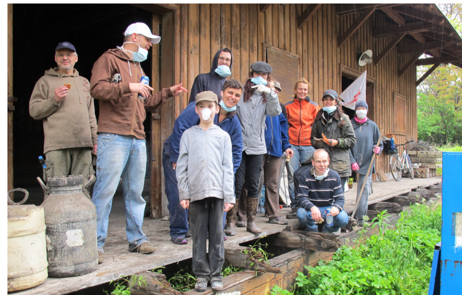
Rodiče při vyklízení Skladu Galerie_13

v řadě mezinárodních soutěží a neztratili se. Práce žáků výtvarného oboru byly vystaveny v Londýně, Honkongu či Mexiku. Výtvarníci bodovali i na Mezinárodní dětské výtvarné výstavě v Lidicích. Vysokou úroveň opakovaně potvrzuje i hudební oddělení. V minulém školním roce se jeho žáci umísťovali na předních místech všech soutěží, kterých se zúčastnili, a také letošní rok začal velmi slibně. Škola získala již dvakrát ocenění v soutěži Tanečního centra Praha Taneční učitel roku . Vytvořit a vést fungující vzdělávací a kulturní instituci není jednoduché. Kvalita školy je založena na dobře zpracovaném vzdělávacím programu, zajímavé nabídce oborů, příjemném zázemí pro žáky a hlavně spokojených učitelích, kteří mají rádi svoji práci. Všemi silami se soustředíme na hlavní činnost školy, ale také si zakládáme na vztahu ke kultuře při veškeré vedlejší činnosti, která stejně vždy souvisí s tou hlavní, vzdělávací. Jednou takovou vedlejší aktivitou je naše nová galerie – Sklad Galerie_13 . Je to taková provizorní „klubovna“, kde se věnujeme různým kulturním aktivitám. První akcí byla absolventská výstava našich žáků. Následovala velká výstava absolventů vysoké školy, promítali jsme zde filmy, uspořádali Bleší trh a proběhla zde i řada hudebních vystoupení. Prostor vznikl ve starém nákladovém skladu. Budova dříve sloužila jako překladiště materiálu na nádraží a říkalo se jí magacín. Prostor byl léta